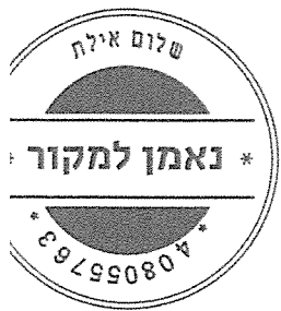
נועה חקלאי, שופטת, סגנית הנשיא

תת"ע 5591-10-20 מדינת ישראל נ' בן יקיר תתי"ע 9699-02-22 פלי"א 918-04-22